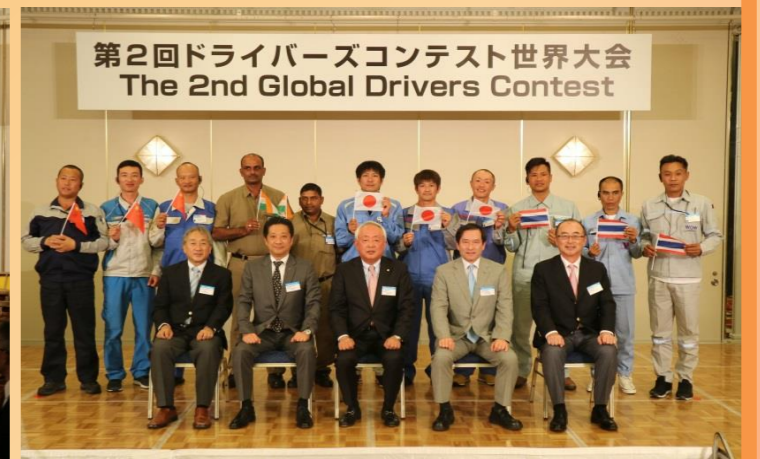
▲ 選手と来賓の方々との記念撮影の様子