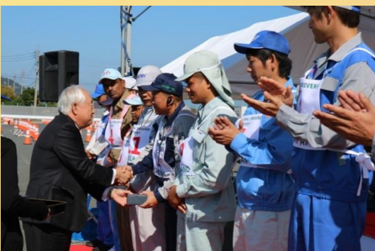
▲ 板坂社長による表彰式での記念品贈呈