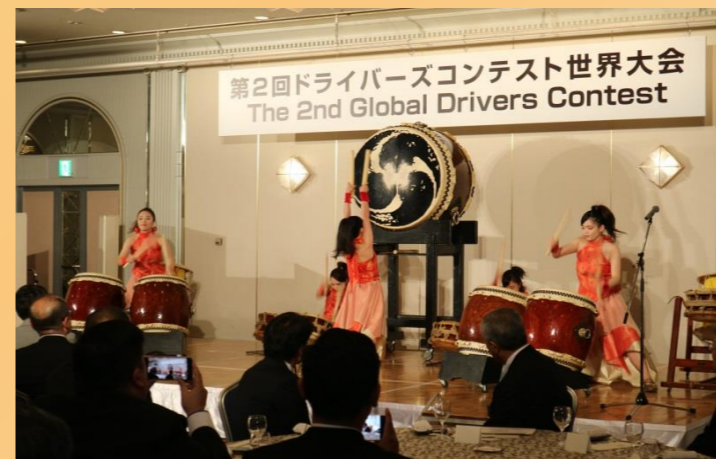
▲ 和太鼓の演奏によるオープニングセレモニー